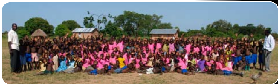
Angole - 1. třída