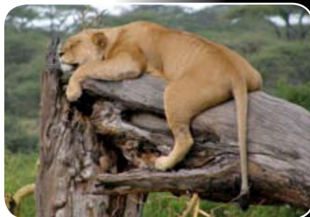
NP QUEEN ELIZABETH - Ishasha

V ceně není vízum do Ugandy - kupuje se jednoduše na letišti po příletu a stojí 50 US dolarů , na jídlo a pití počítejte cca 350 US dolarů , cena letenky cca 25.000 Kč .