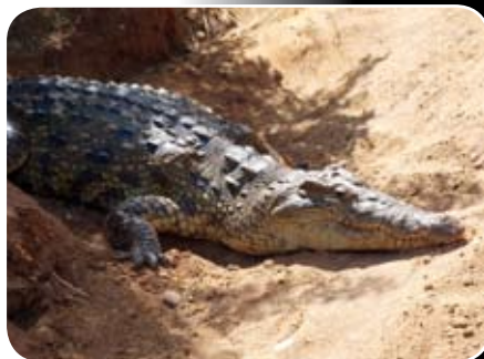
NP MURCHISON FALLS