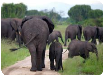
NP QUEEN ELIZABETH