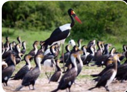
NP QUEEN ELIZABETH - Kazinga