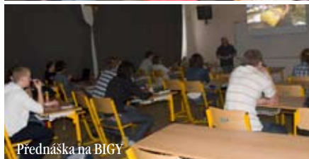
Přednáška na BIGY