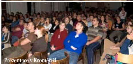
Prezentace v Kroměříži