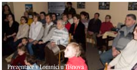
Prezentace v Lomnici u Tišnova