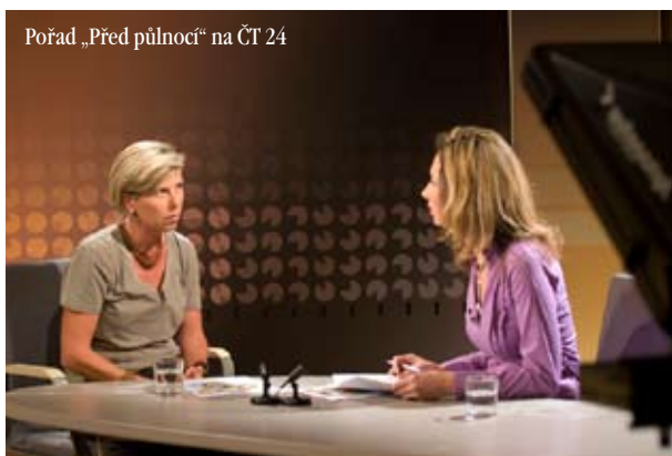
Pořad „Před půlnocí“ na ČT 24

Hlavním cílem naší organizace je samozřejmě pomáhat v Ugandě a činnost spojená s tímto úsilím nám zabere také nejvíce času. Přesto se současně snažíme vykonávat i osvětovou činnost v České republice a seznamovat širokou veřejnost se životními podmínkami a kulturními odlišnostmi v Ugandě. K tomu využíváme řadu příležitostí - pořádáme besedy, prezentace, promítání, vernisáže a výstavy, publikujeme v časopisech a svou činnost se snažíme představovat i ve veřejných médiích - rozhlasu a televizi. K tomu, aby bylo možné takovou činnost vyvíjet je samozřejmě nutné mít v zásobě dostatečnou a kvalitní foto a videodokumentaci, kterou je potřeba neustále doplňovat a rozšiřovat během našich pracovních cest do Ugandy. Tak například pro pořádání výstav máme v současné době k dispozici 35 velkoformátových fotografií a k nim deset oboustranných stojanů. K tomu ještě okolo 50 ks skleněných fotoklipů s fotografiemi o rozměru 300 x 450 mm. Mimoto se snažíme z natočených materiálů připravovat dokumenty, které bývají buď časově nebo obsahově přizpůsobovány aktuálním akcím, na kterých jsou promítány. Další možnosti jak upozornit na naši činnost a podmínky života v Ugandě, jsou dlouhotrvající vý-