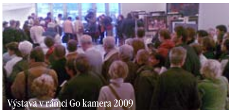
Výstava v rámci Go kamera 2009