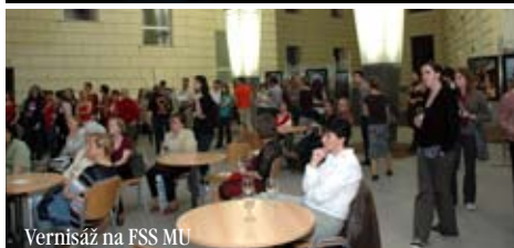
Vernisáž na FSS MU