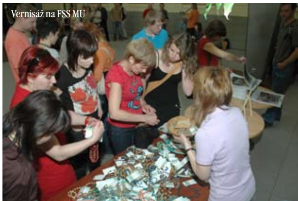
Vernisáž na FSS MU