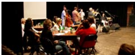
Setkání hum. organizací v Divadle Husa na provázku