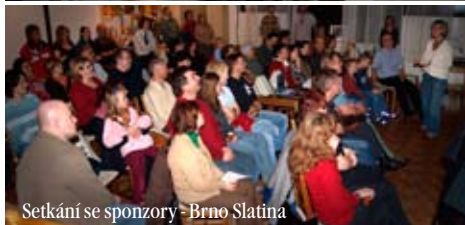
Setkání se sponzory - Brno Slatina