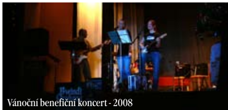
Vánoční benefiční koncert - 2008